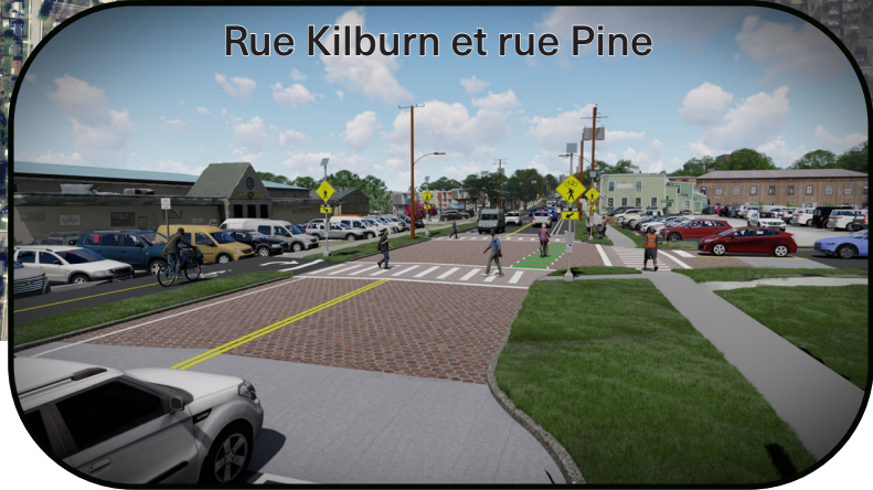
Rue Kilburn et rue Pine