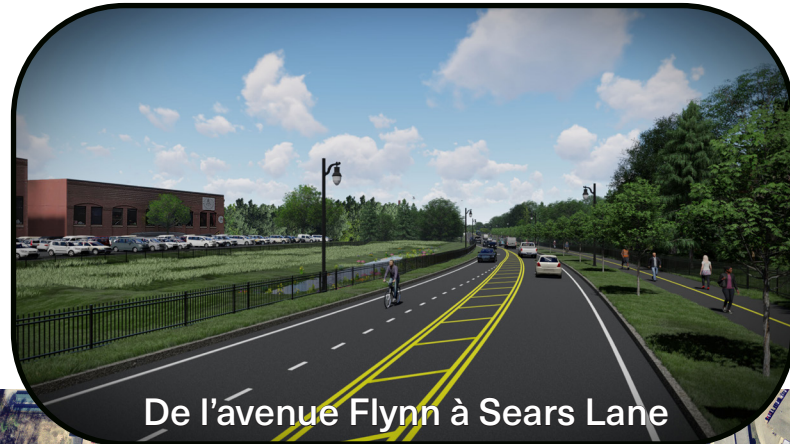
De l'avenue Flynn à Sears Lane