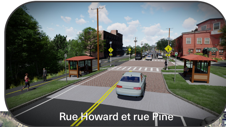
Rue Howard et rue Pine