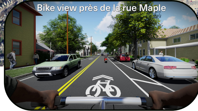
Bike view près de la rue Maple

La Promenade Champlain Parkway permettra d'améliorer l'accès entre la I-189/U.S. Route 7 Échangeur vers le district du centre ville de Burlington et le secteur riverain du centre-ville ; AMÉLIORER LA CIRCULATION, LA MOBILITÉ ET LA SÉCURITÉ dans les rues locales ; ASSURER LA CIRCULATION dans le quadrant Sud-Ouest de Burlington ; éliminer les perturbations dans les quartiers locaux ; SÉPARER LE TRAFIC LOCAL ET TRANSITAL ; et RÉDUIRE LE TRAFIC DES CAMIONS sur le réseau routier local.