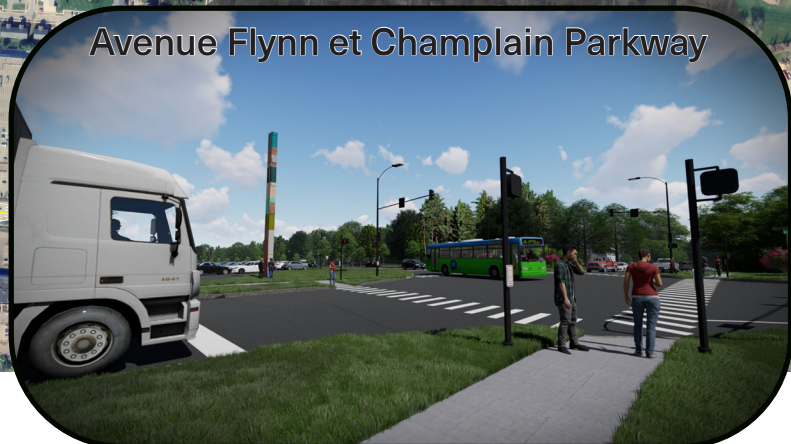
Avenue Flynn et Champlain Parkway