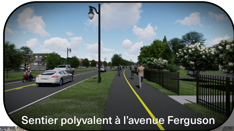
Sentier polyvalent à l'avenue Ferguson