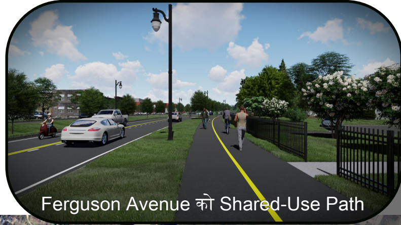
Ferguson Avenue को Shared-Use Path