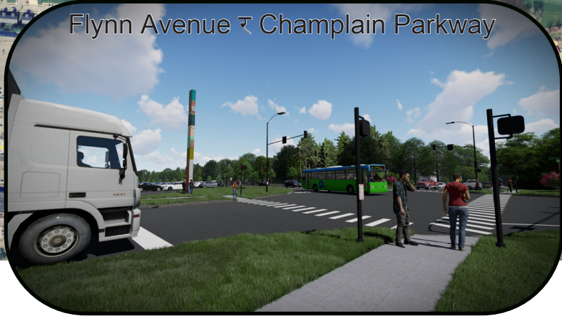
Flynn Avenue र Champlain Parkway