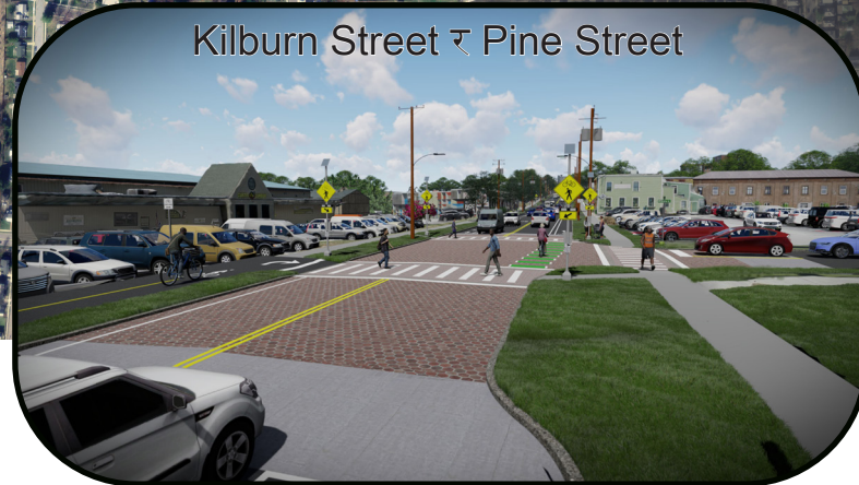
Kilburn Street र Pine Street