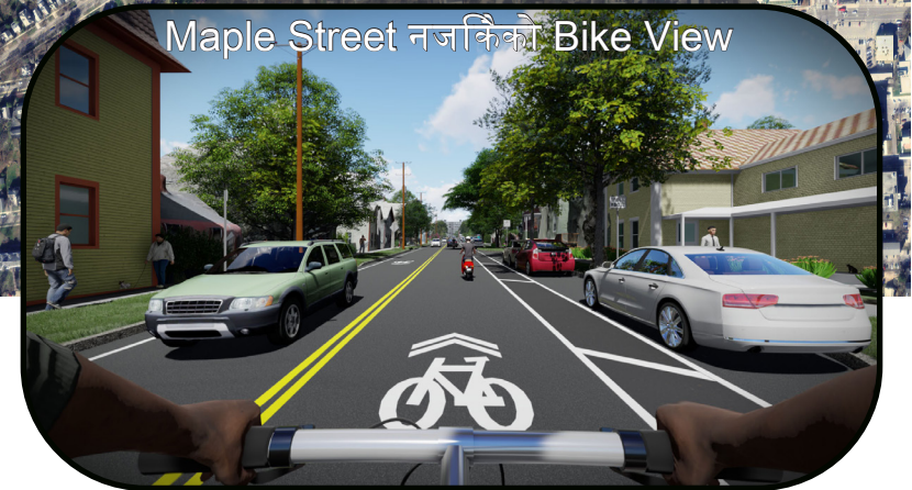
Maple Street नजदिकीको Bike View

The Champlain Parkway I-189/U.S. Route 7 Interchange देखी Burlington City Center District र downtown waterfront area मा सुधार हुनेछ; स्थानीय सडकमा परिसंरचना, गतशिलिता र सुरक्षा; southwestern quadrant of Burlington मा ट्राफिक सहजता; स्थानीय तहमा अवरोधहरू हटाउनु; स्थानीय र वरपर ट्राफिकलाई अलग गर्नु; र स्थानीय सडक नेटवर्कमा ट्रक ट्राफिक घटाउने