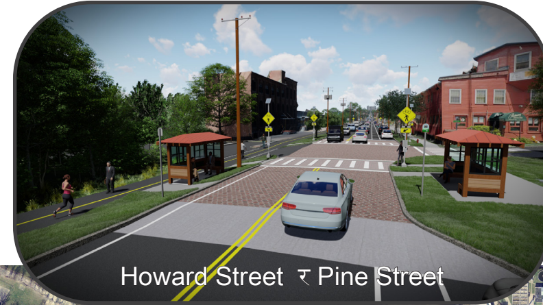
Howard Street र Pine Street