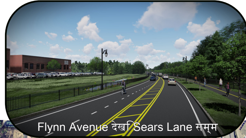
Flynn Avenue देखी Sears Lane सम्म